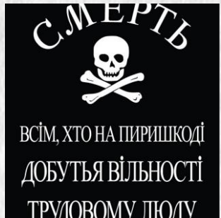
Революционная повстанческая армия Нестора Махно (махновцы)