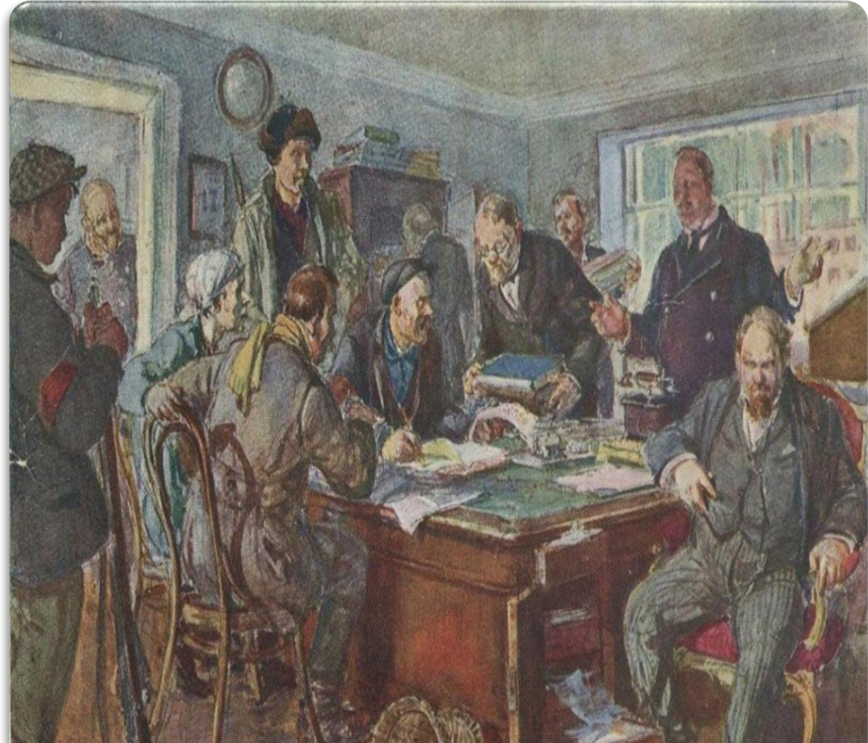
Картина Г. Савицкого «Национализация предприятия»

Цель: Переход от частной собственности к государственному управлению.