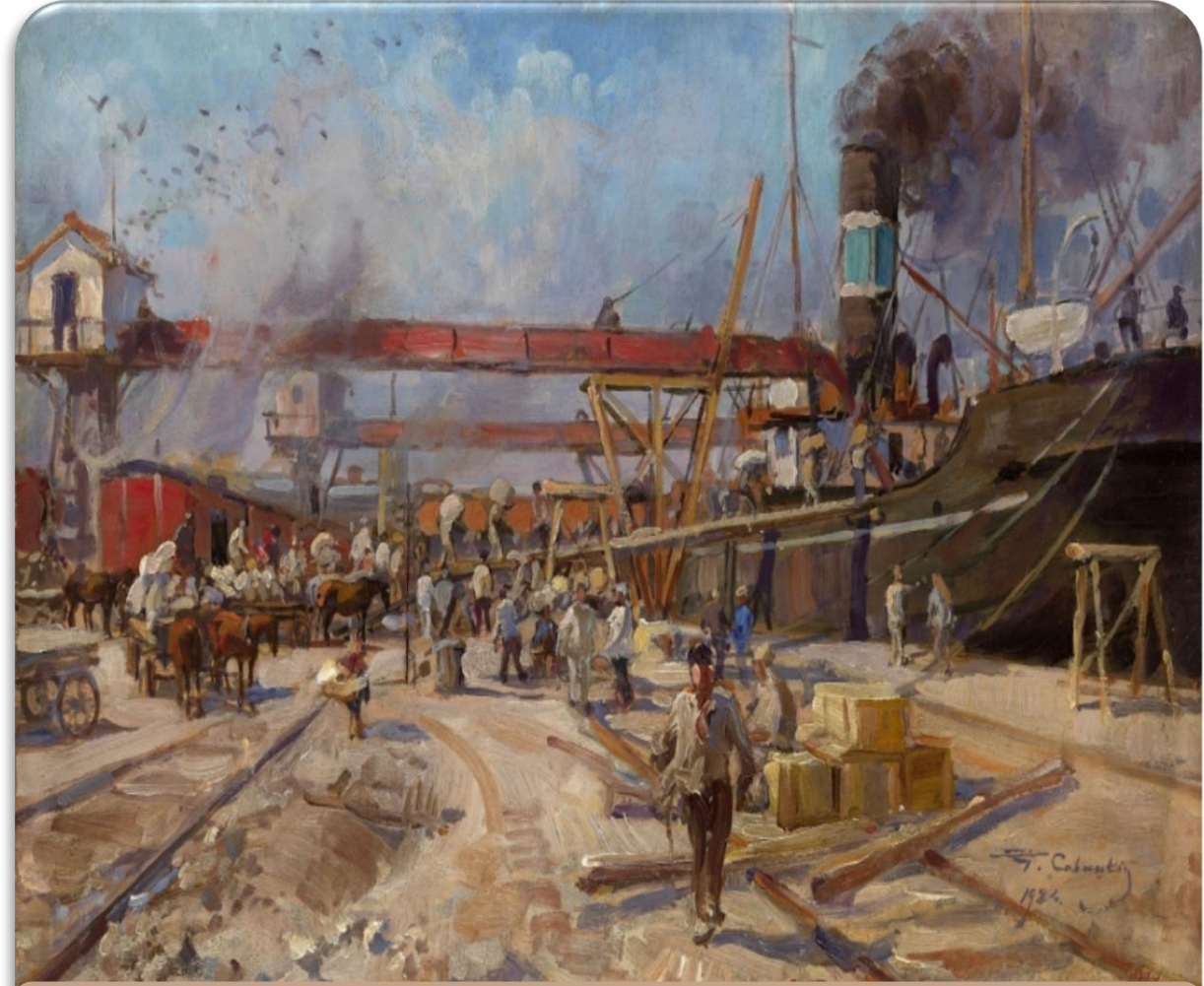
Картина Г. Савицкого «Порт»