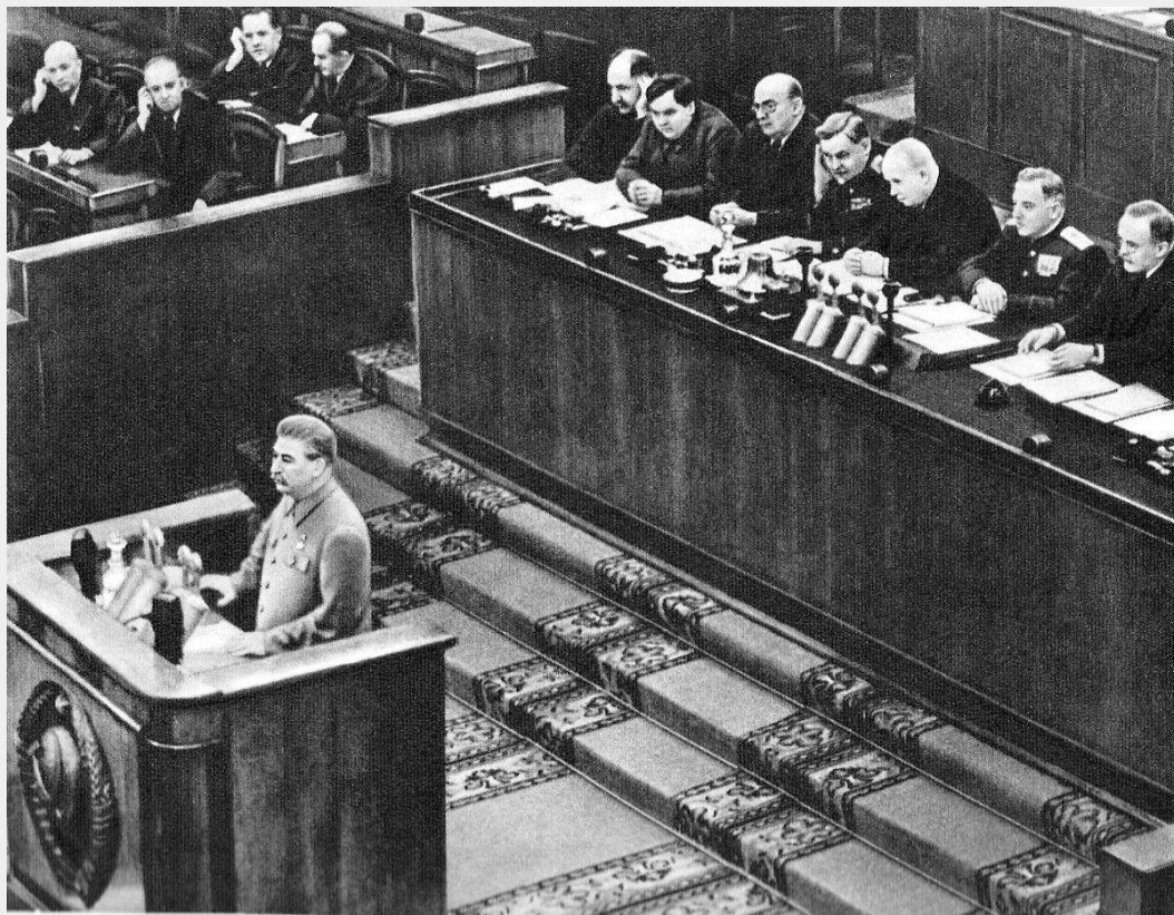
Выступление Сталина на XIX съезде партии

В этой презентации мы рассмотрим основные особенности политической системы в СССР после 1945 года. Мы узнаем о роли Коммунистической партии, изменениях в государственном устройстве, а также о влиянии этих изменений на жизнь советских граждан.