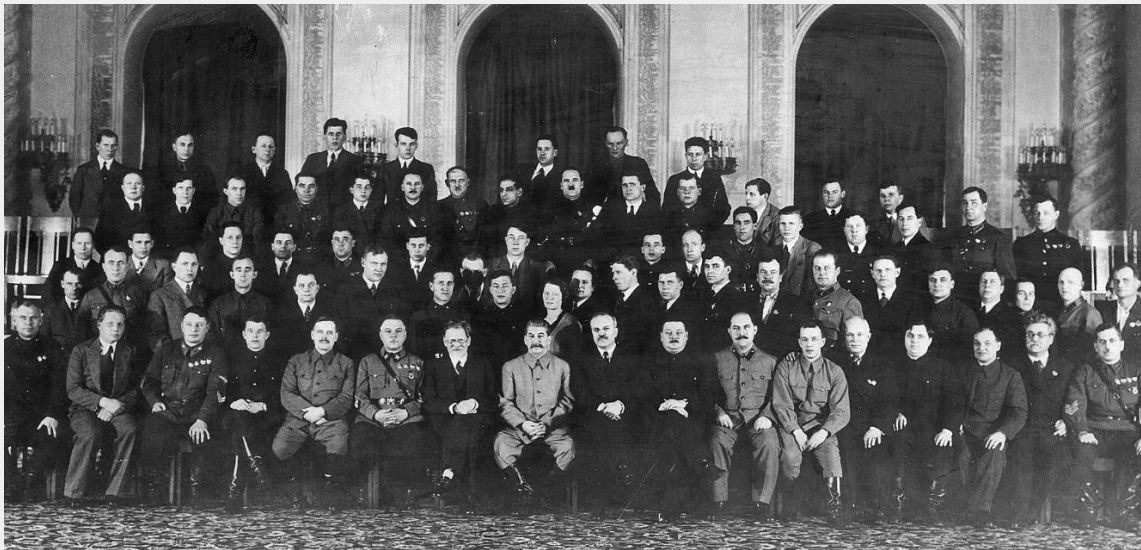
Делегаты XVIII съезда ВКП (Б) 1939 г.

После войны роль КПСС ещё больше усилилась. Партия стала более централизованной и авторитарной. Это привело к укреплению культа личности Сталина, который стал символом советского государства.