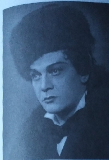
С. Лемешев в роли Ленского