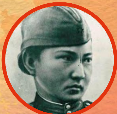
АЛИЯ МОЛДАГУЛОВА (1925–1944)

снайпер, ефрейтор, Герой Советского Союза