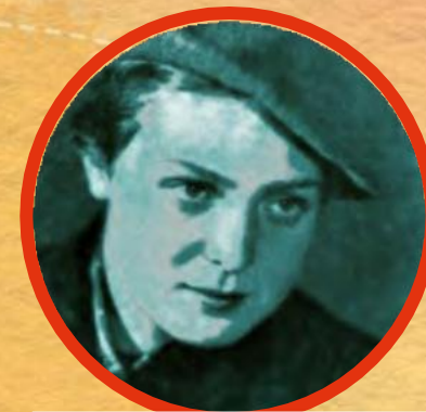
МАРИОНЕЛЛА (ГУЛЯ) КОРОЛЁВА (1922–1942)

танкист, старший лейтенант, Герой Советского Союза