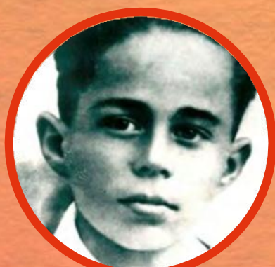
ВОЛОДЯ ДУБИНИН (1927–1942)

снайпер, ефрейтор, Герой Советского Союза