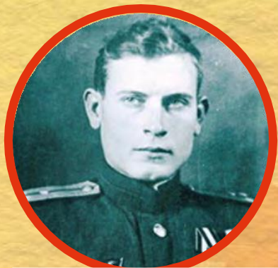
ИВАН ТУРКЕНИЧ (1920–1944)

старший лейтенант, артиллерист, Герой Советского Союза