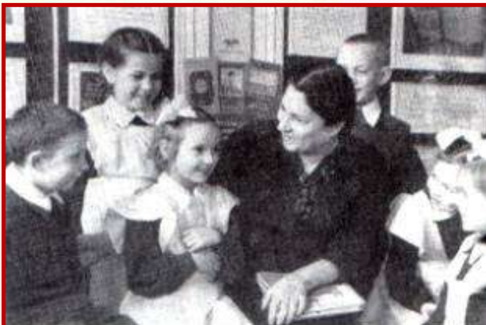
А. Л. Барто с юными читателями.