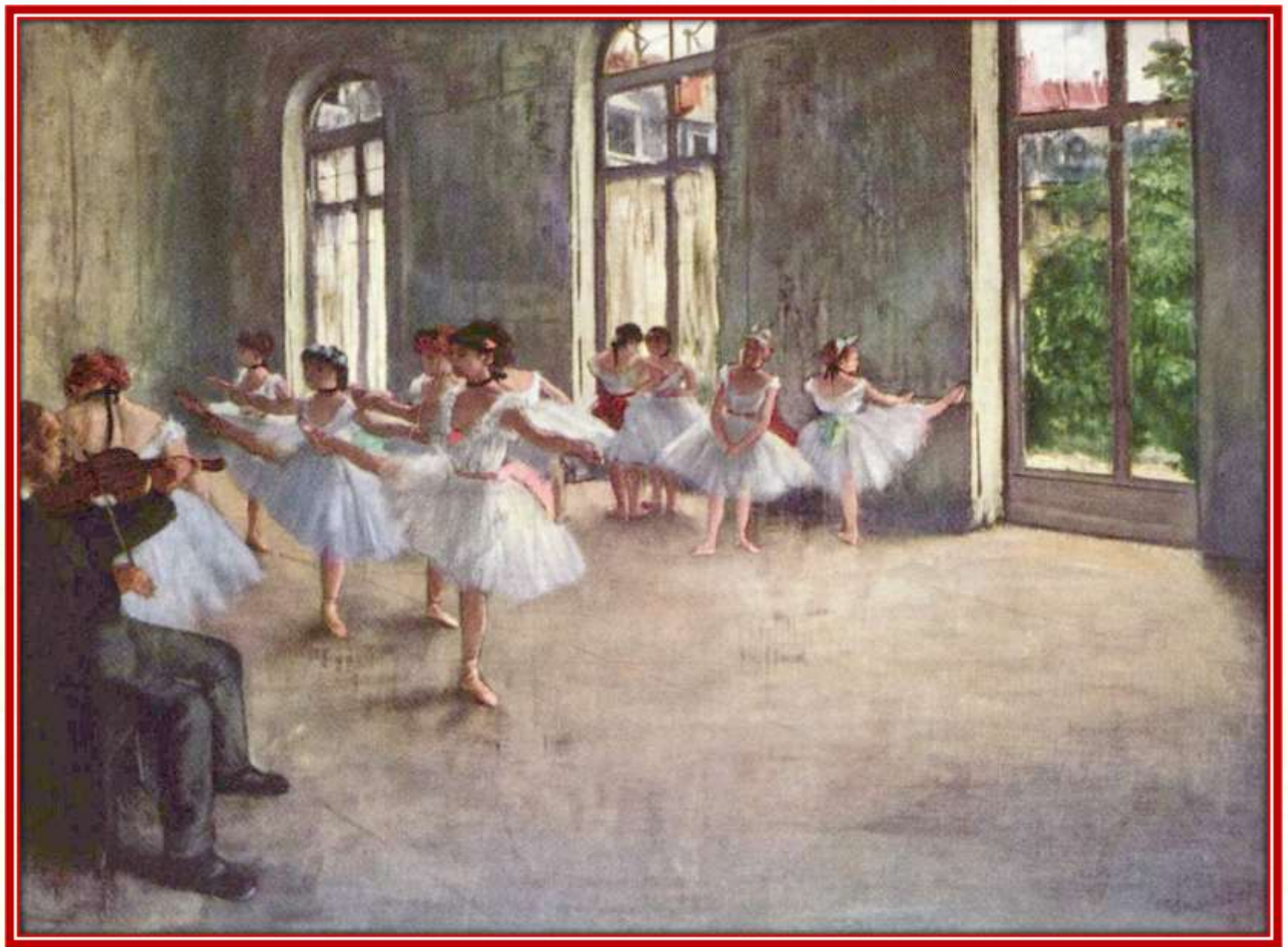
Эдгар-Жермен - Илер Дега . Репетиция балета