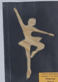
Работу выполнила ученица 1-ой группы Чистяки Олеся