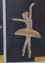
Работу выполнила ученица 1-ой группы